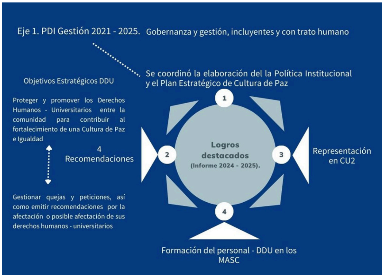
Figura 3. Logros alcanzados.

Como organismo defensor de los derechos de los universitarios y desde una gestión comprometida con la aplicación del Reglamento de la Defensoría de los Derechos Universitarios, luego de mostrar los datos con respecto a las actividades relacionadas con la protección y defensa, la difusión y la divulgación, quejas, gestión y orientaciones así como acuerdos intrainstitucionales e interinstitucionales, en el siguiente esquema se muestran los logros más destacados coordinados por la Defensoría en beneficio de la comunidad universitaria.