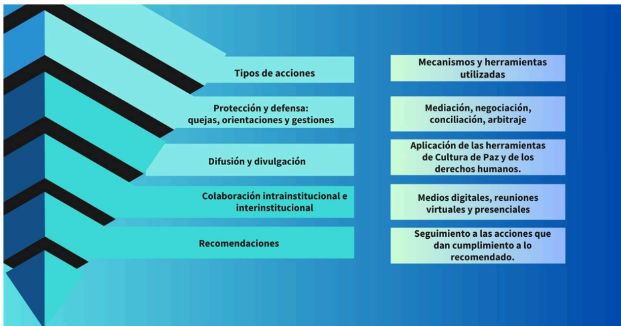
Figura 2. Tipos de acciones, mecanismos y herramientas utilizadas por la Defensoría.