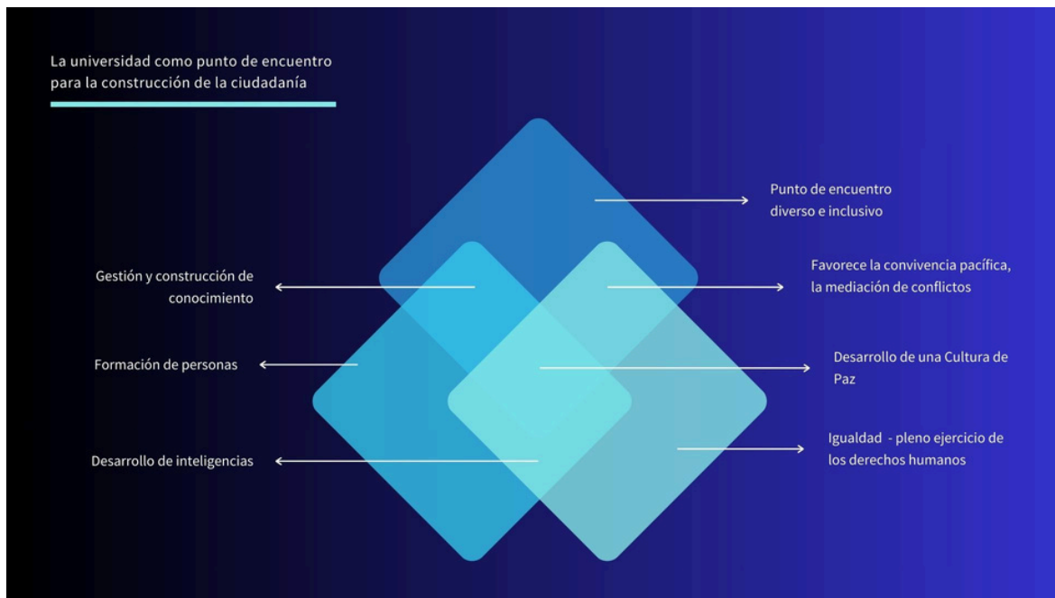
Figura 1. La universidad como punto de encuentro para la construcción de la ciudadanía.

Con base en las ideas antes expresadas, los resultados que hoy se presentan son producto de potenciar las funciones y procedimientos propios de la Defensoría de los Derechos Universitarios en la institución, propiciar sinergias y acuerdos institucionales para afrontar comportamientos, resolver conflictos de manera pacífica, proteger y defender los derechos humanos – universitarios de las personas quienes integran la comunidad universitaria, aspectos que contribuyen de manera significativa a la resiliencia institucional y a la generación de aprendizajes desarrollados en comunidad.